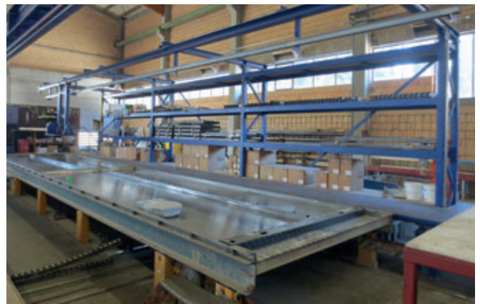
Después: A la izquierda, el nuevo equipo MRP de última generación con un nuevo sistema de control. A la derecha, el puesto de encofrado manual en forma de sistema de puesto de trabajo con carro de herramientas desplazable, pistola de pegamento, lubricador manual, así como sistema de estanterías y pasarela a lo largo de la bandeja. Pupitres de mando para el desplazamiento de las bandejas directamente junto a la estación de trabajo. Sobre la bandeja se encuentran los nuevos encofrados laterales con imanes integrados.