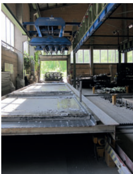
Antes: Desencofrado en una sola posición de bandeja y un solo puesto de apilado / carro de salida