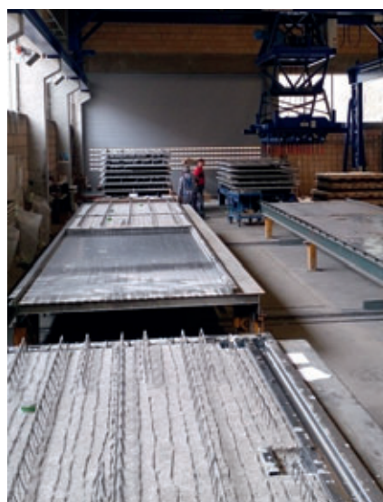
Después: Desencofrado en dos posiciones de bandejas y tres puestos de apilado con dos carros de salida