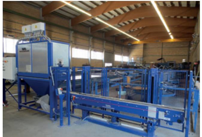
Después: Sistema de transporte de encofrados con equipo limpiador-lubricador para encofrados laterales con imanes integrados. Limpieza-lubricación automática de los encofrados laterales y transporte de los encofrados laterales directamente desde el puesto de desencofrado hasta el puesto de encofrado.