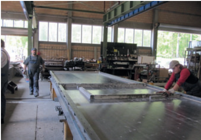
Antes: Encofrados e imanes separados, almacenamiento de las piezas de encofrado y de montaje, así como de herramientas y pistolas de pegamento, etc. del lado frontal de la bandeja haciendo necesarios largos recorridos. Limpieza manual de los encofrados y los imanes.