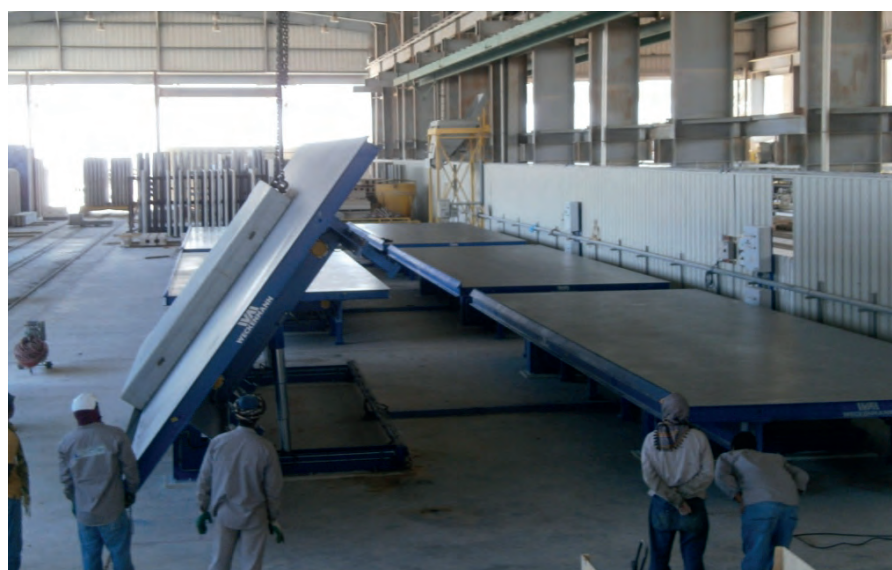
Современные поворотные стенды Weckenmann отличаются фирменным немецким качеством