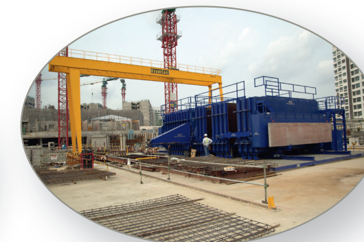
Almacén de armadura