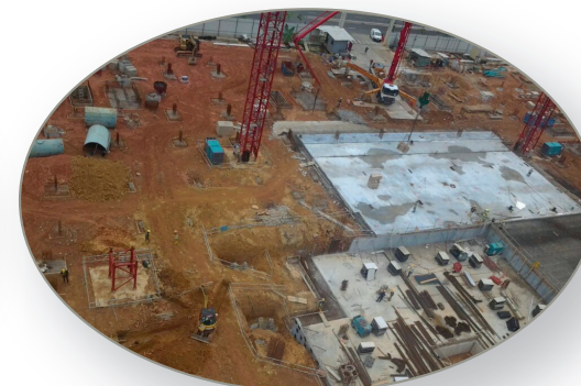
Cimentación preparada para el montaje de la MBM