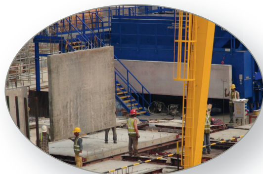
Elevar y retirar los elementos acabados