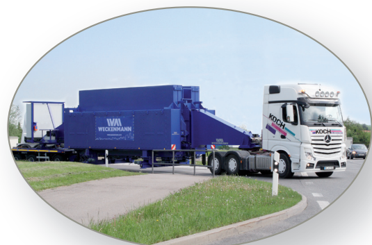
Transporte por carretera