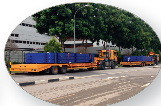
Transporte de los paneles intermedios la de batería