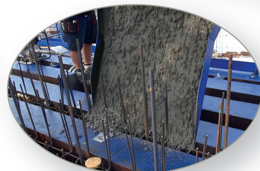
Llenar los compartimentos individuales con concreto