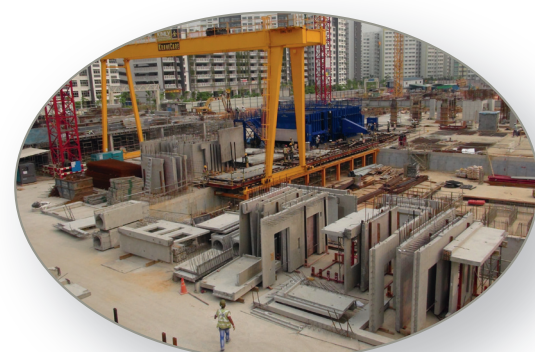
Instalación con almacén para los elementos prefabricados acabados