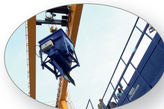
Distribuidor de concreto