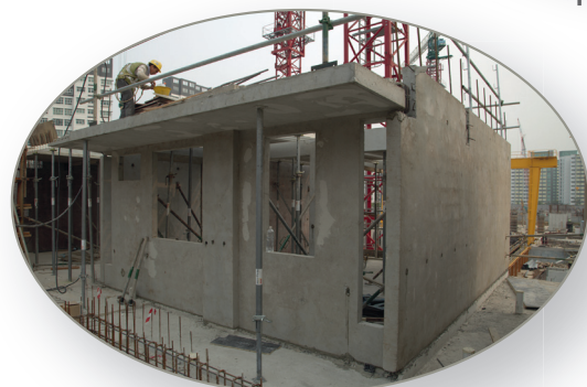
Muros y paredes ya instalados