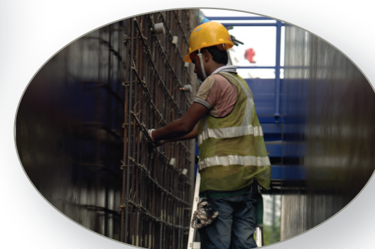
Colocación del encofrado