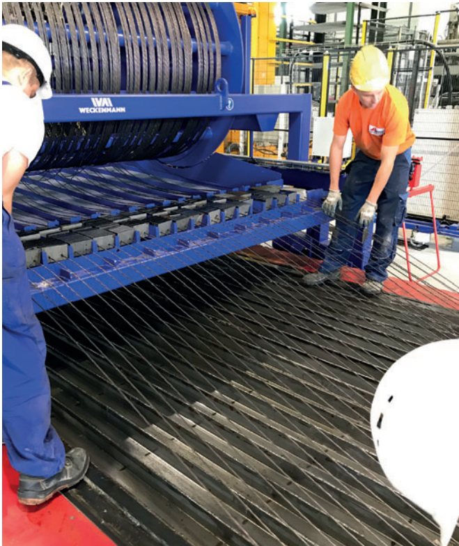
Транспортный барабан для натяжных арматурных тросов

Rector Polen смогла удвоить свои производственные мощности по преднапряженным плитам перекрытия и дополнительно расширить свой ассортимент за счет новых изделий (пустотелые блоки и преднапряженные ж/б переемычки).