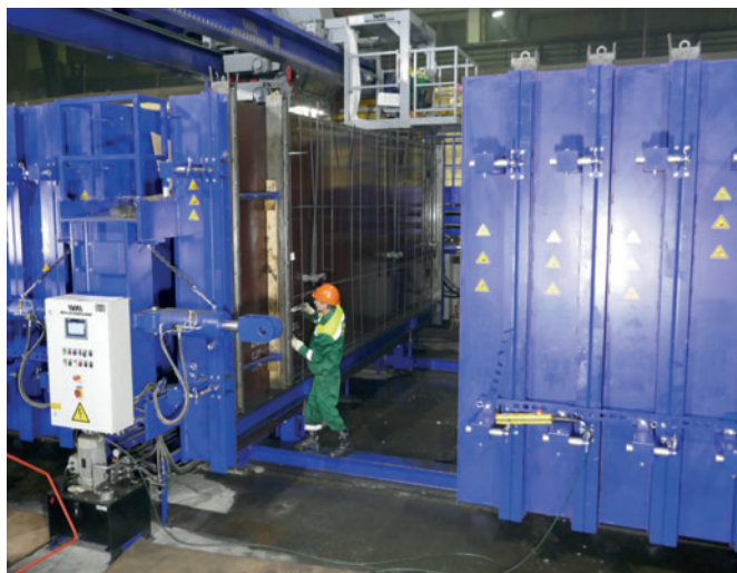
Подготовка отсека. Армирование

дукции. Надежная конструкция от «Weckenmann» позволяет заполнять отсеки бетоном по отдельности. То есть бетон в каждый из отсеков может быть уложен снизу вверх отдельно. Так, изготовленный сборный железобетонный элемент останется плоским и не будет выгибаться. Каждый из отсеков кассетной опалубки оснащен пятью интегрированными в панель внутренними вибраторами, так что вся кассетная опалубка содержит в себе 110 внутренних вибраторов. Внутренняя вибрация отдельных отсеков является разработкой фирмы «Weckenmann», и она подкупает высокой эффективностью производства кассетных опалубок, а также равномерным распределением энергии вибрации по площади. В каждый отсек встроены внутренние трубы отопления, ускоряющие схватывание железобетонных элементов и сокращающие время их производства. Разность температур на поверхности отсека составляет лишь \pm 5^{\circ}\text{C} , что делает возможным гомогенное затвердевание железобетонных элементов.