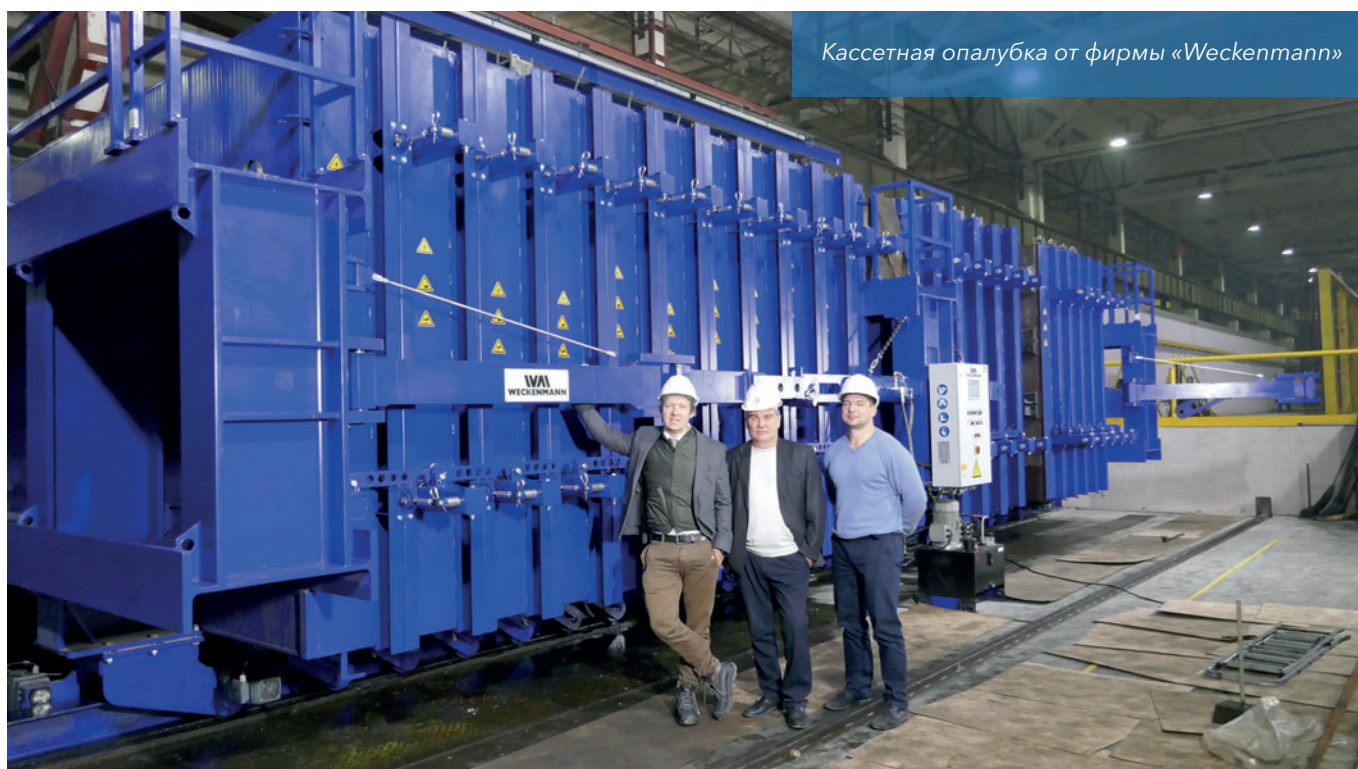
Кассетная опалубка от фирмы «Weckenmann»

Фирма «Weckenmann Anlagentechnik GmbH & Co. KG» находится южнее Штуттгарта, в г. Дорметтинген, пользуется очень хорошей известностью в СНГ в качестве специалиста и лидера рынка по оборудованию для производства сборного железобетона. За последние 15 лет фирма модернизировала множество предприятий в СНГ и поставила более 40 кассетных установок в Россию и ближайшие страны. Томская домостроительная компания уже имеет две линии циркуляции поддонов, производство фундаментных свай в формах и систему адресной подачи бетона, а также с успехом применяет магнитные борты и боксы от фирмы «Weckenmann», и поэтому выбор опять пал на «Weckenmann».