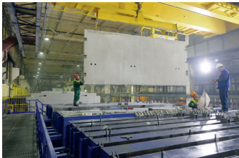
Съем готовых панелей

Отсеки кассетной опалубки состоят из единого калиброванного листа из специальной стали. Благодаря этому создаются