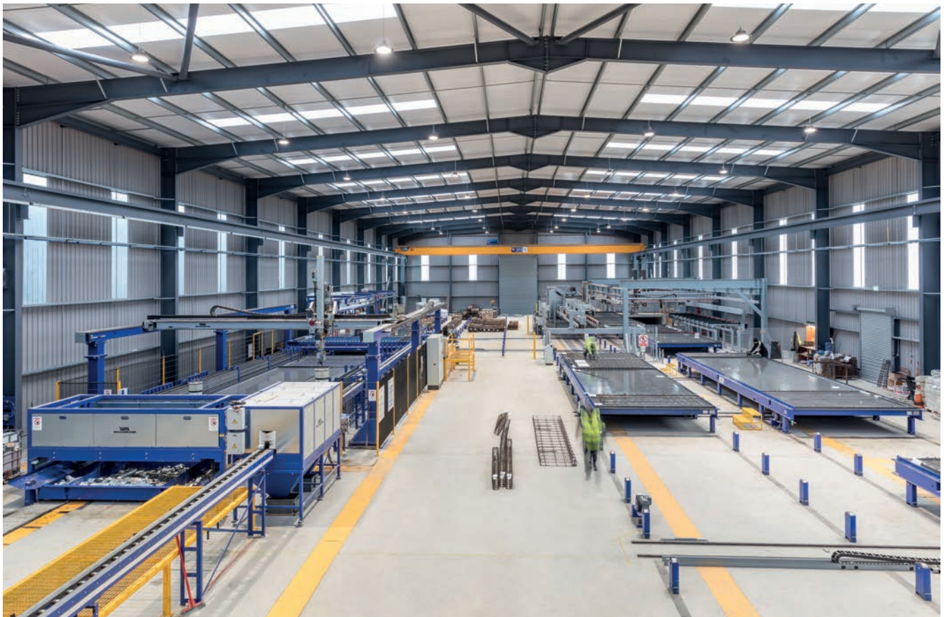
爱尔兰公司 Keegan Precast 的循环设备