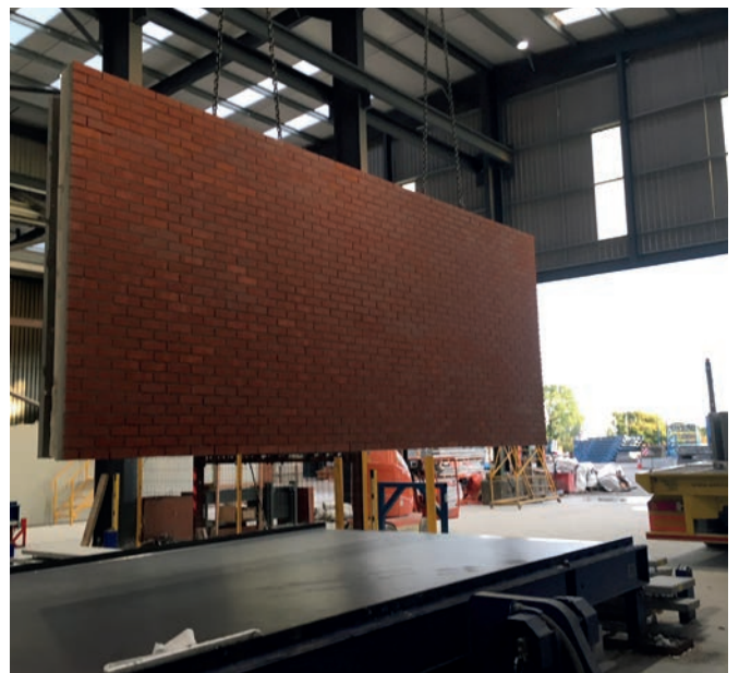
加工好的预制混凝土砖构件