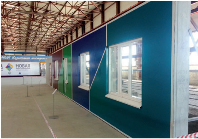
Listos para el montaje en obra: Muros laterales prefabricados de hormigón con ventanas ya instaladas.

el 30 de agosto de 2016 se celebró la inauguración de la segunda gran instalación de Weckenmann en presencia del gobernador, Berdylbek Spararbaev. El fabricante de elementos prefabricados de hormigón Uy Kurylys produce allí desde mediados de 2016 forjados, elementos sándwich, muros interiores, elementos de huecos de ascensor y escaleras.