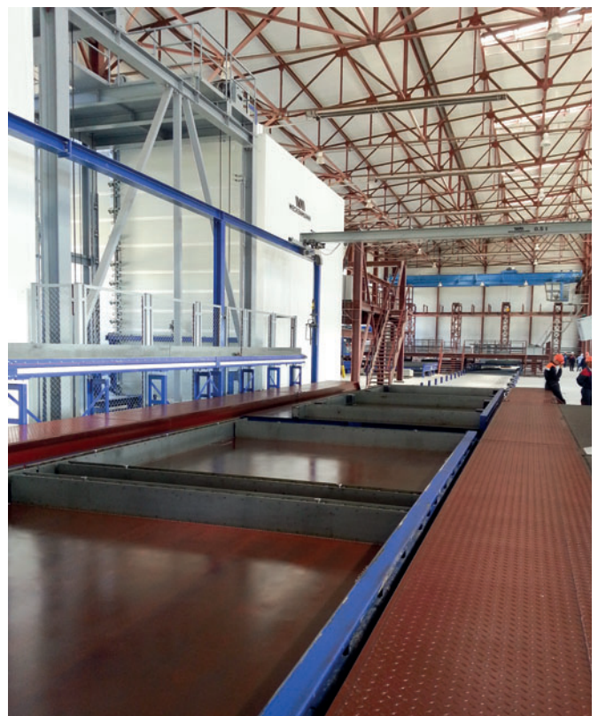
Nueva instalación de circulación de grandes dimensiones para elementos prefabricados de hormigón construida por Weckenmann en Kazajistán.

El fabricante de máquinas e instalaciones suabo Weckenmann puso exitosamente en funcionamiento a comienzos de 2016 una de las fábricas de prefabricados de hormigón más grandes de Kazajistán para la empresa GLB en Astana. Con la fábrica de prefabricados de hormigón en Aktobé (antiguamente Aktjubinsk), la quinta ciudad más grande de Kazajistán,